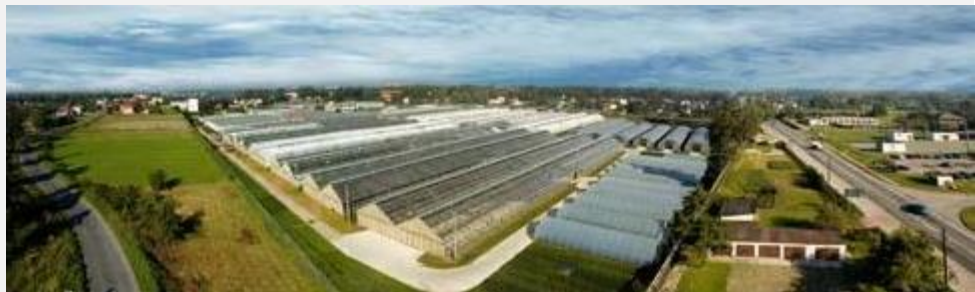
Siedziba Plantpol w Zabierzu z lotu ptaka